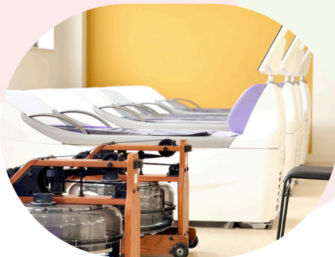
緑 リラクゼーションゾーン